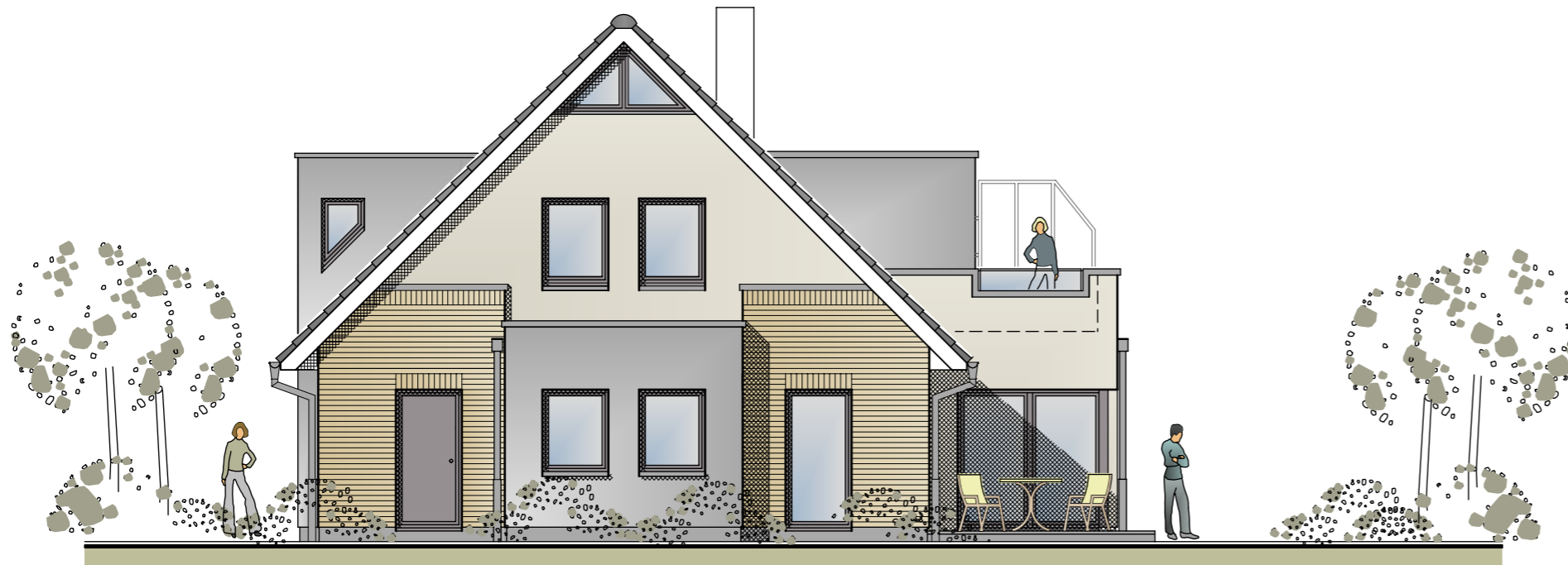
NORD - WESTEN