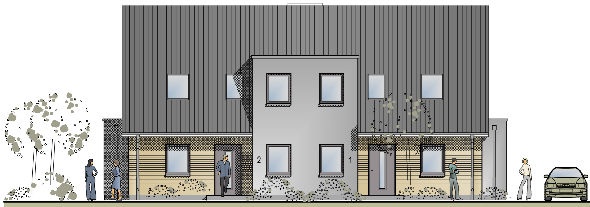
NORD - OSTEN