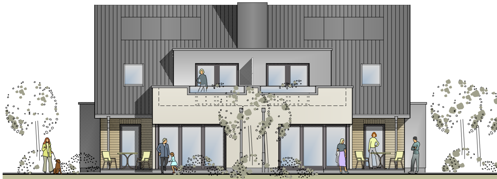
SÜD - WESTEN